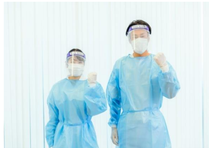
PPE（ガウン・マスク・フェイスシールド・手袋）